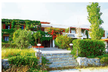
hotel souda mare