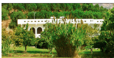
hotel damnoni paradise