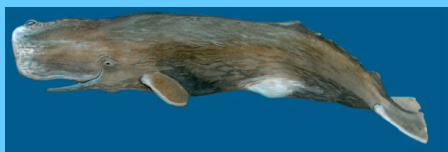
pottwal (10) sperm whale

zur ordnung der waltiere gehören nach neusten erkenntnissen z.zt. ca. 85 verschiedene arten. im meer vor la gomera sind in den letzten fünfzehn jahren 21 verschiedene meeressäugerarten gesichtet und bestimmt worden. am häufigsten treffen wir die hier abgebildeten zehn arten.