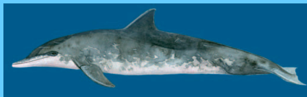
rauzahndelfi n (6) rough-toothed dolphin