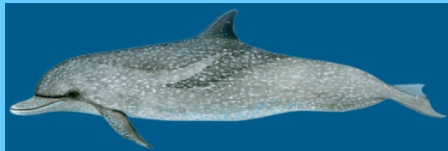
zügeldelfi n (2) spotted dolphin