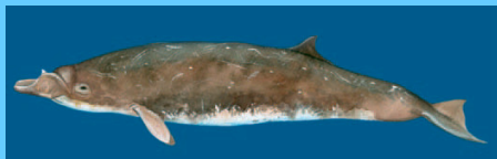
blainville schnabelwal (7) dense beaked whale