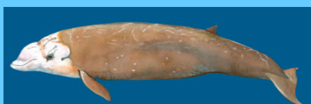
cuvier schnabelwal (8) cuvier's beaked whale