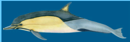
gemeiner delfi n (3) common dolphin/ delphinus delphis