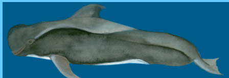
indischer grindwal (4) short finned pilot whale