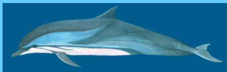
streifendelfi n (5) striped dolphin